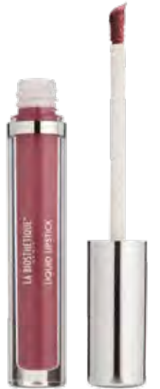
Liquid Lipstick Frosted Berry