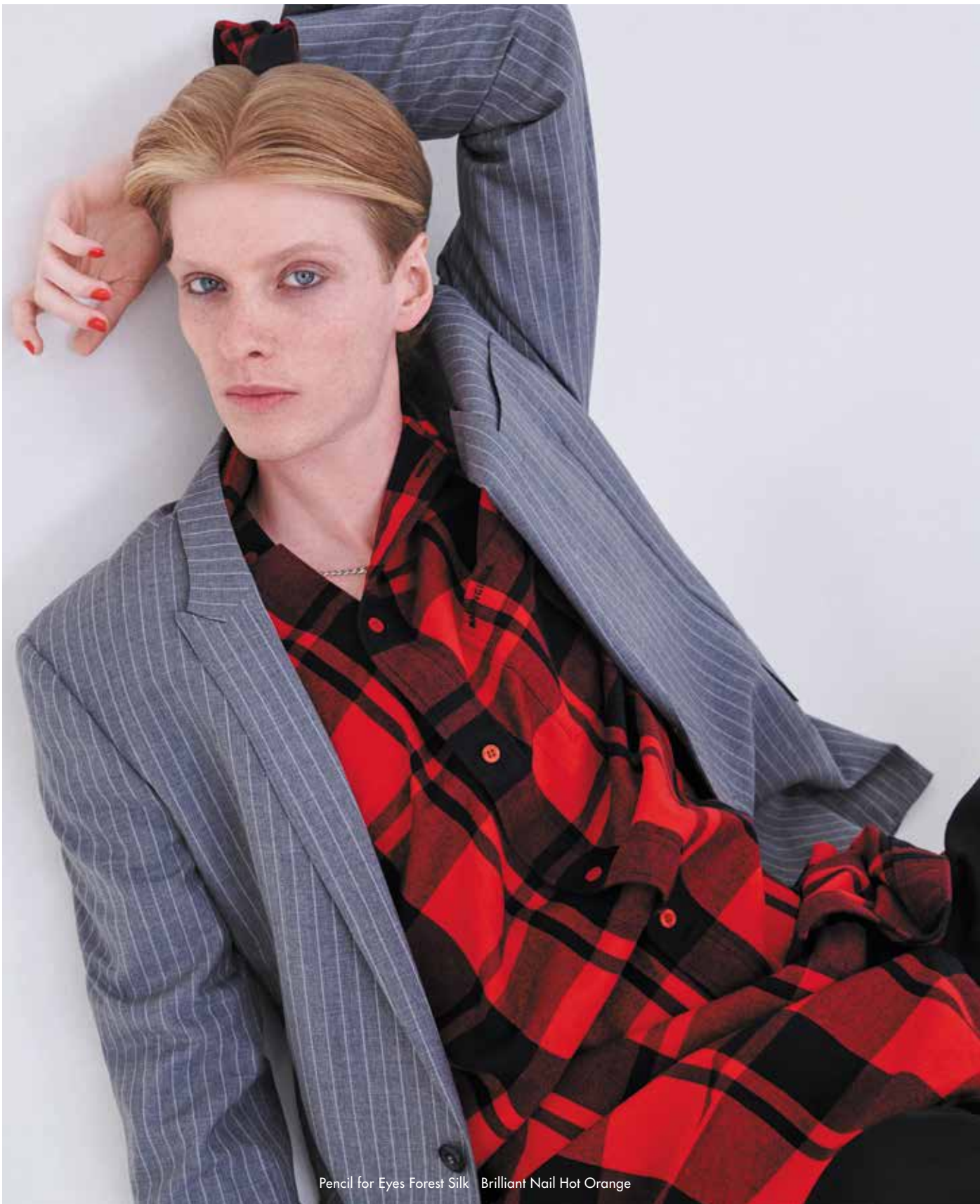
Pencil for Eyes Forest Silk Brilliant Nail Hot Orange