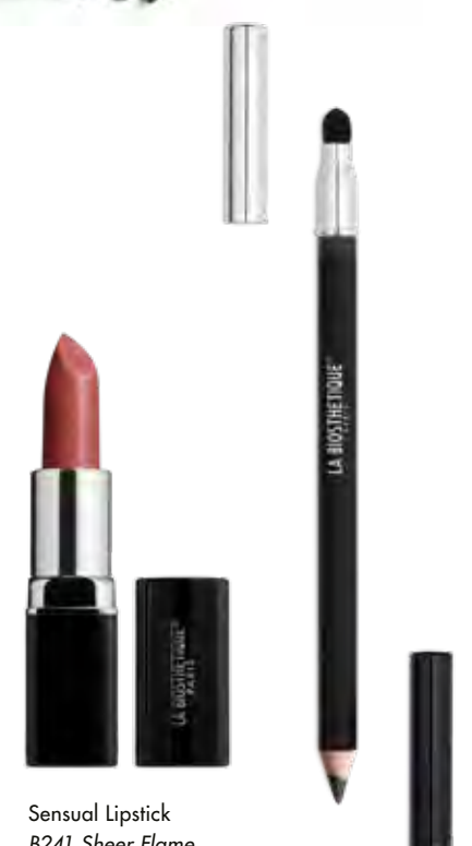
Sensual Lipstick B241 Sheer Flame