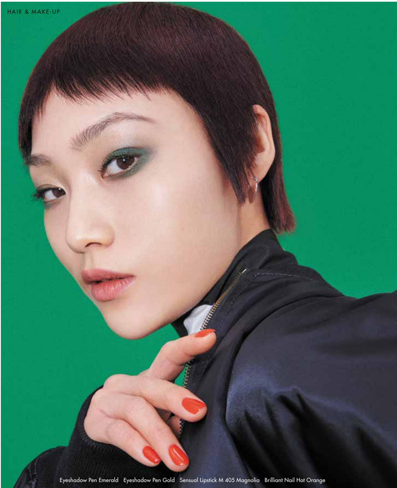
Eyeshadow Pen Emerald Eyeshadow Pen Gold Sensual Lipstick M 405 Magnolia Brilliant Nail Hot Orange