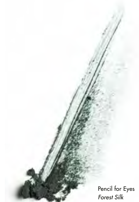
Pencil for Eyes Forest Silk